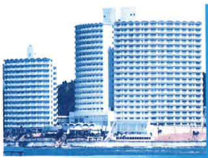
南紀田辺保養所 (和歌山県)

設立母体会社であるコスモグループ所有の保養所（南紀白浜、南紀田辺、淡路島、有馬、泉郷蓼科）を、福利厚生として利用可能なことをご存知でしょうか。現代社会は非常にストレスフルな社会であり、心の健康を害する人も少なくありません。ストレスの発散方法は人それぞれですが、景観地（行楽地）にある素晴らしい保養所を家族や友達等と利用し、心身共にリフレッシュを図ってみるのはいかがでしょうか。興味のある方は各施設の事務員にお気軽にお問合せ下さい。尚、ストレス関連で申しますと、昨年12月からストレスチェック制度が義務化され、平成会・大阪平成会においても実施方法等についての検討を行っております。今後におきましても、従業員にとって働き甲斐のあるまた、働きやすい職場環境作りに創意工夫してまいります。