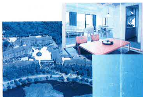
夢科保養所 (長野県)