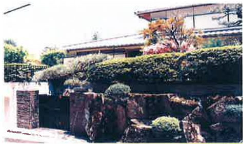
有馬保養所 (兵庫県)