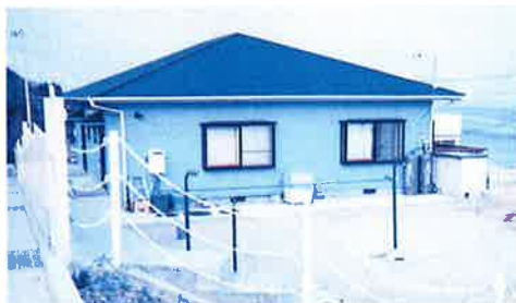
淡路島保養所 (兵庫県)