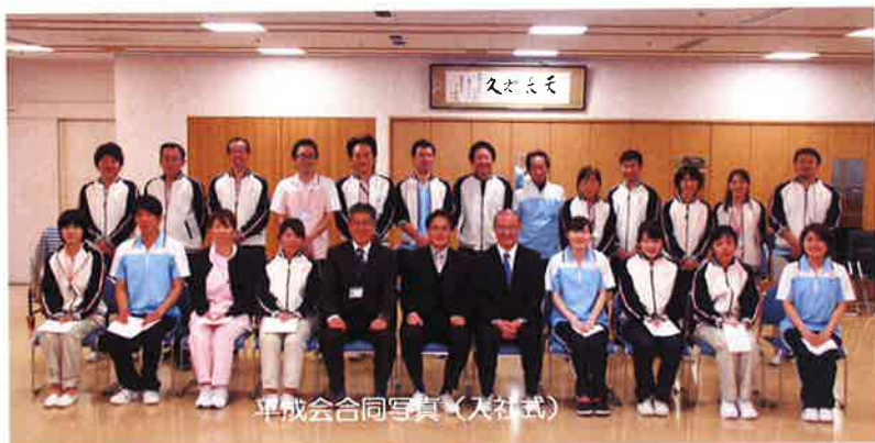
平成会合同写真(大社式)