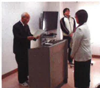
南理事長から竹本施設長への表彰状授与

平成会・大阪平成会ともに、開設記念日である3月1日（西長洲荘・芦風荘）と、3月15日（ふれ愛丸山荘）に永年勤続表彰式を執り行いました。日々の業務精励に感謝致しますとともに、益々のご活躍を期待致します。