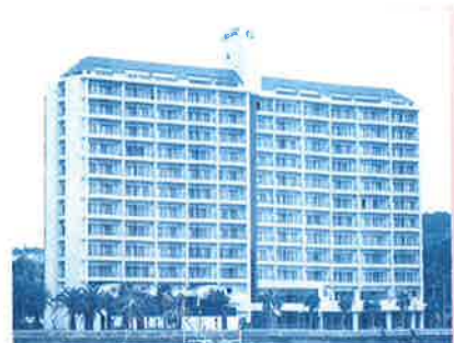
南紀白浜保養所 (和歌山県)

社会福祉法人 平成会 http://www.heiseikai.or.jp 特別養護老人ホーム 西長洲荘 短期入所生活介護事業 通所介護事業 訪問介護事業 居宅介護支援事業所 福祉用具貸与事業 ケアハウス花みずき 大庄北地域包括支援センター