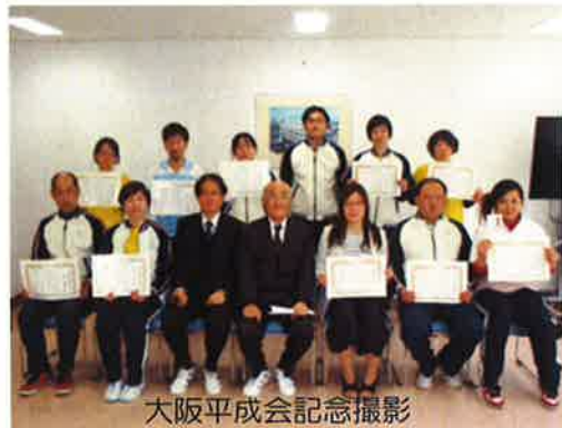
大阪平成会記念撮影